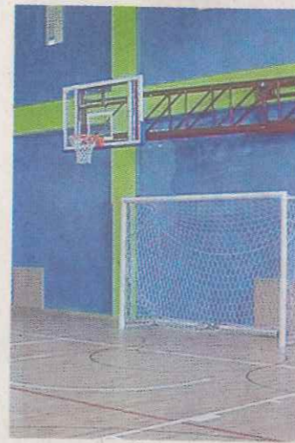
L'interno. A S. Andrea domina il blu