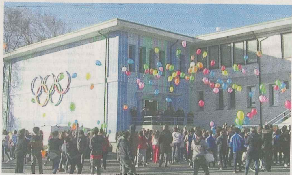
Palloncini. Festa grande a San Vigilio per l'inaugurazione della palestra